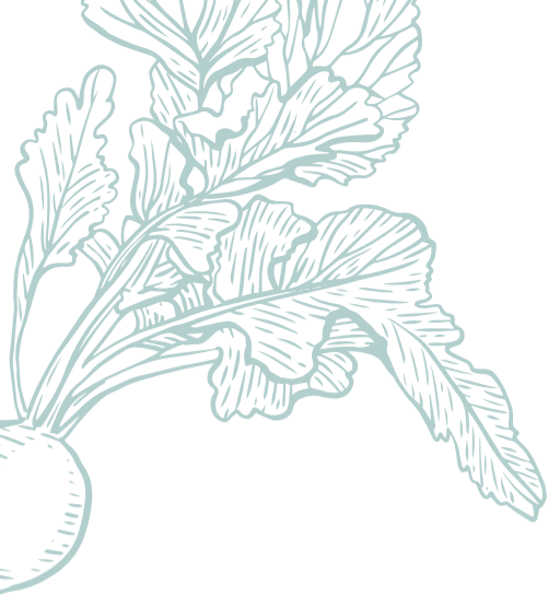
TABELA DE ALERGÉNIOS